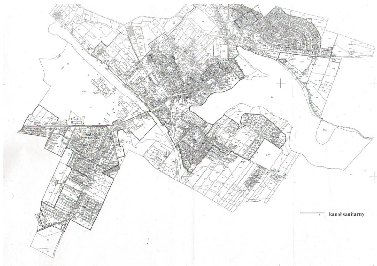
Rys. 3. Tereny objęte zmianą planu miejscowego